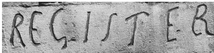
"Résister" inscription gravée sur la margelle du puits de la Tour de Constance, attribuée à Marie Durand